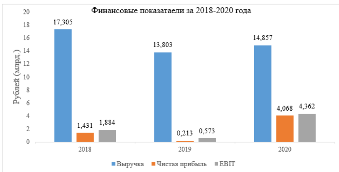
Рисунок 3 – Финансовые показатели ООО «Агрофирма Ариант» за 2018–2020 года